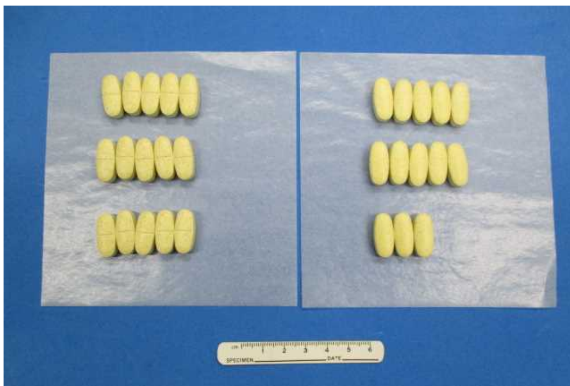
中に入っていた錠剤を薬包紙に並べた様子 (28錠入り)